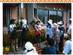
(社) 日本家庭園芸普及協会 「グリーンアドバイザー」による育 ちのアドバイスや園芸相談、花苗 などを被災地へ贈りました。