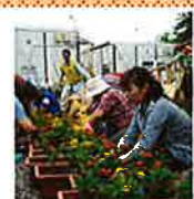
(財) 都市緑化機構 宝くじ協会の協力により花苗など を被災地へ贈りました。