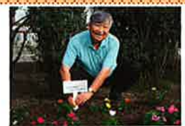
(社) 日本公園緑地協会 石巻市の仮設住宅へ花苗を贈りま した。